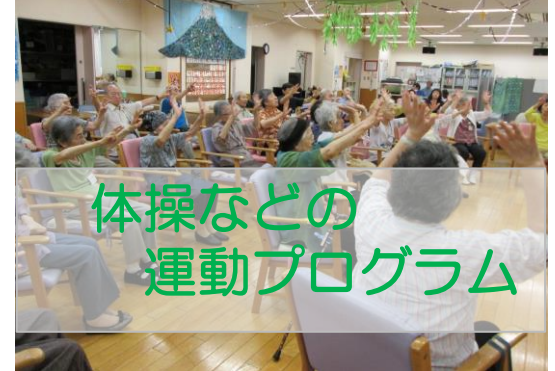
体操などの 運動プログラム