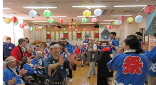
各種ゲームやイベントを実施