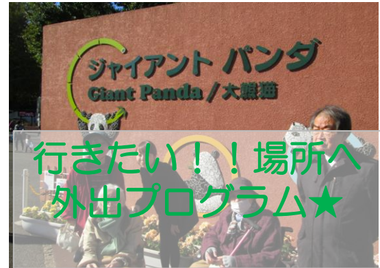
行きたい!! 場所へ 外出プログラム★