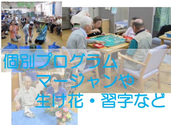
個別プログラム マーじゃんや 生け花・習字など