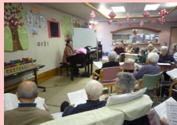
♪音楽療法教室♪ 楽しく音楽に触れて頂き、脳・心身の活性化を図ります！