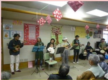
♪リナポエポーエ 演奏会♪ ウクレレで楽しいひととき！