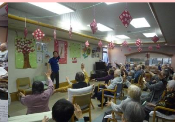
★ダンスレクリエーション★ 他事業所職員によるダンスと体操のプログラムです！心身への刺激にもなり効果的な機能訓練になっています！