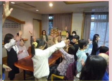
★小学校交流会★ 子供達から元気を頂きました！