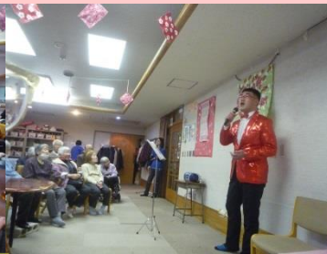
♪職員コンサート♪ 職員による演奏会です！