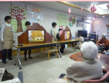
★朗読教室★ 近隣図書館の方が来られました