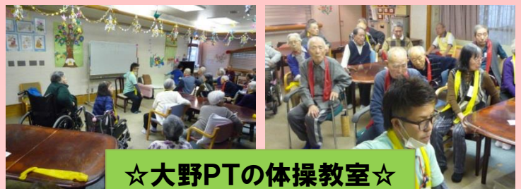
☆大野PTの体操教室☆ 理学療法士による体操教室です！

インフルエンザが心配される時期となりました。 外出時のマスク着用 帰宅時の手洗い、うがい 在宅時の加湿、換気 などにも気を配り、予防を心掛けましょう！