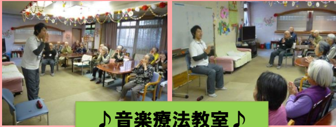
♪音楽療法教室♪ 音楽に合わせて元気に楽しく！