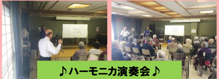
♪ハーモニカ演奏会♪ ボランティアの方によるコンサートです！