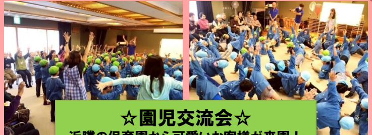
☆園児交流会☆ 近隣の保育園から可愛いお客様が来園！