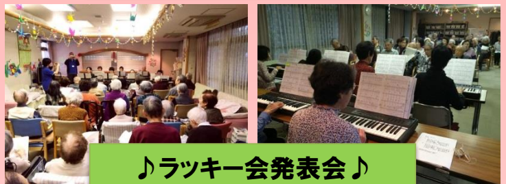
♪ラッキー会発表会♪ キーボードサークルさんの演奏会です！

インフルエンザが心配される時期となりました。 外出時のマスク着用 帰宅時の手洗い、うがい 在宅時の加湿、換気 などにも気を配り、予防を心掛けましょう！