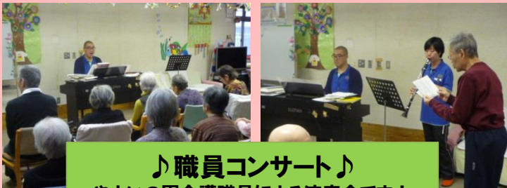
♪職員コンサート♪ やよいの園介護職員による演奏会です！