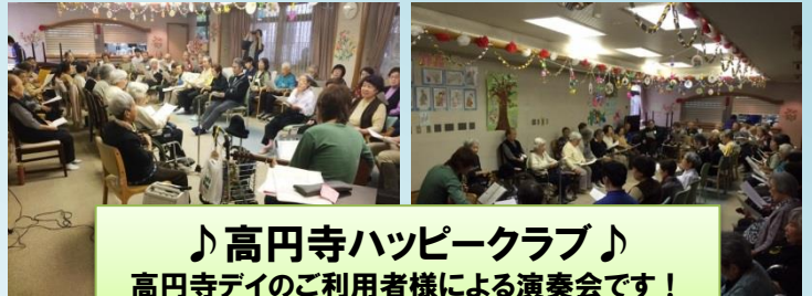
♪高円寺ハッピークラブ♪ 高円寺デイのご利用者様による演奏会です！