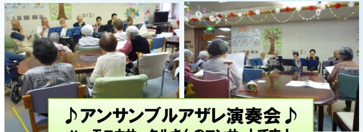
♪アンサンブルアザレ演奏会♪ ハーモニカサークルさんのコンサートです！