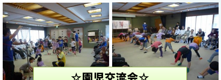
☆園児交流会☆ 近隣の保育園から可愛いお客様が来園！