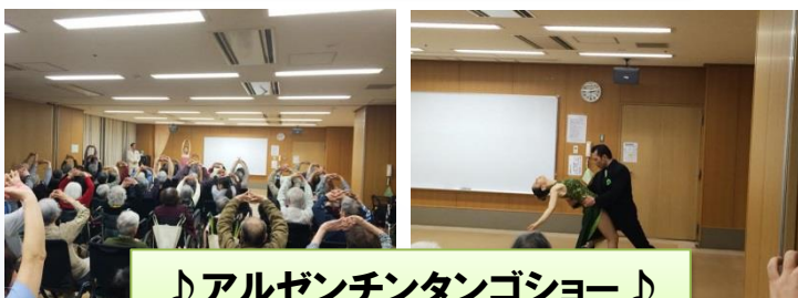
♪アルゼンチンタンゴショー♪ せせらぎデイにお出掛けしてきました！