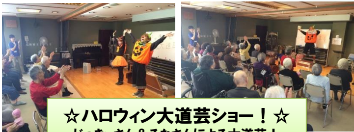
☆ハロウィン大道芸ショー！☆ じっきいさん＆るなさんによる大道芸！