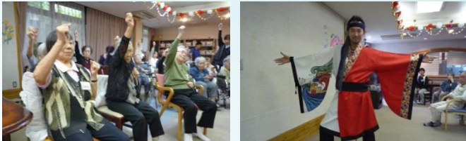
☆ダンスレクリエーション☆ 大人気！振付に合わせてしっかり体操！