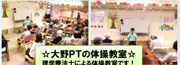
☆大野PTの体操教室☆ 理学療法士による体操教室です！