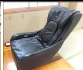
マッサージチェア