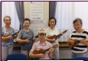
登録団体の活動紹介