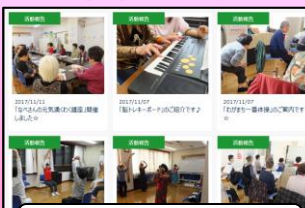
各種協働事業の紹介