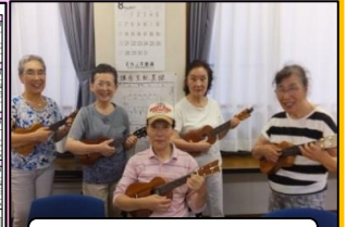
登録団体の活動紹介