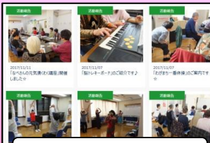
各種協働事業の紹介