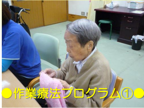
●作業療法プログラム①●