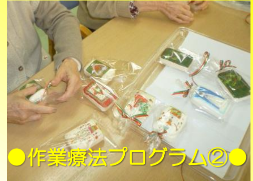
●作業療法プログラム②●