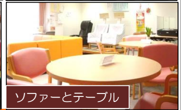
ソファーとテーブル