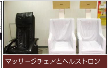
マッサージチェアとヘルストロン