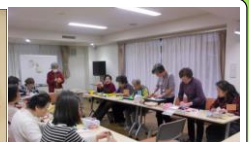
折り紙サロンの様子