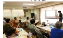
明るい気持ちになりました。

午前・午後で、2回開催しました。眉やチークなど、メイクの仕方をご指導頂き、実際に皆さま自身でやっていただきました。メイクが仕上がって、終了された時に、晴れ晴れとした様子だったので、とても嬉しかったです。