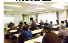
歯の磨き方も学びました。

歯にまつわる歯槽膿漏の治療や予防方法を学び、自分に合った入れ歯の作り方などをお聞きました。質問も多く飛び交い、普段聞けないことも丁寧に分かり易く、先生が説明してくれるので、皆さま大満足でした。