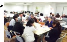
質問が多く出ました。

お薬を飲む時のポイントや注意点、ジャンケンを用いた脳トレし、温・冷湿布の効果の違い、背中に上手に貼る方法なども教えて下さり、おおいに盛り上がりました。質問も気兼ねなく出されたなどたくさんのご意見をいただきました。