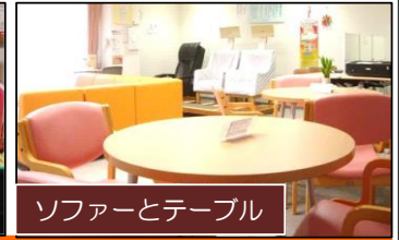
ソファとテーブル