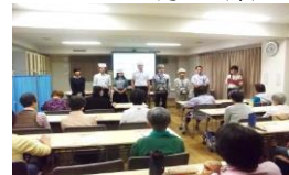
詐欺に気を付けましょう。