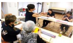
とても綺麗でした。