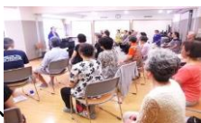
豊かな響きでした。