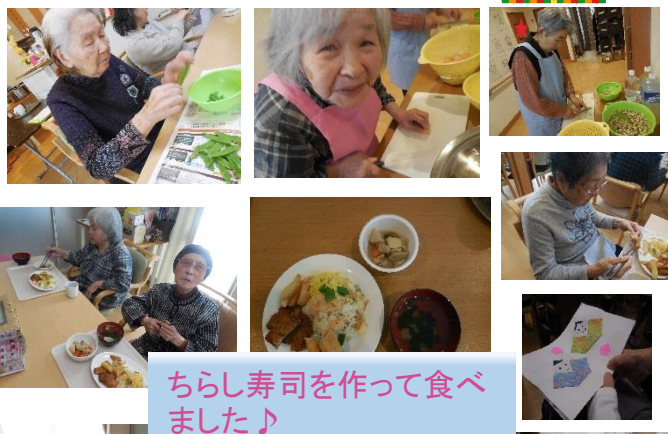
ちらし寿司を作って食べました♪