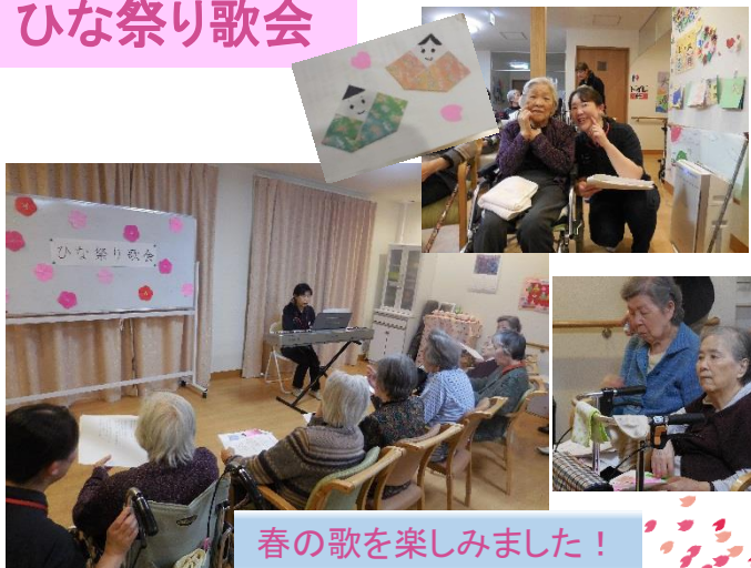
春の歌を楽しみました！