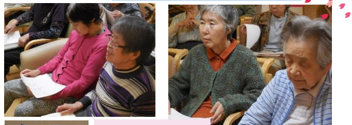
ちらし寿司、さくらもちも楽しめました