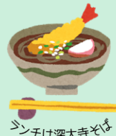
シソチは深大寺そば