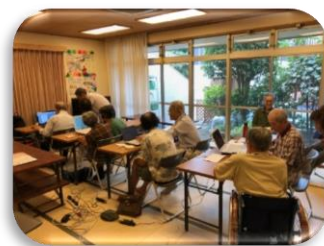
初心者パソコン相談会の様子

日時 2月14日(木) ①午後1時30分～ ②午後2時30分～ 場所：休養室 定員：①、②共に4名 講師：練馬176地域ITリーダーの会 申込：随時 事務所 窓口または電話にて受付