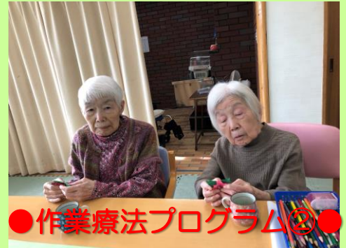
●作業療法プログラム②●