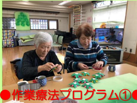
●作業療法プログラム①●